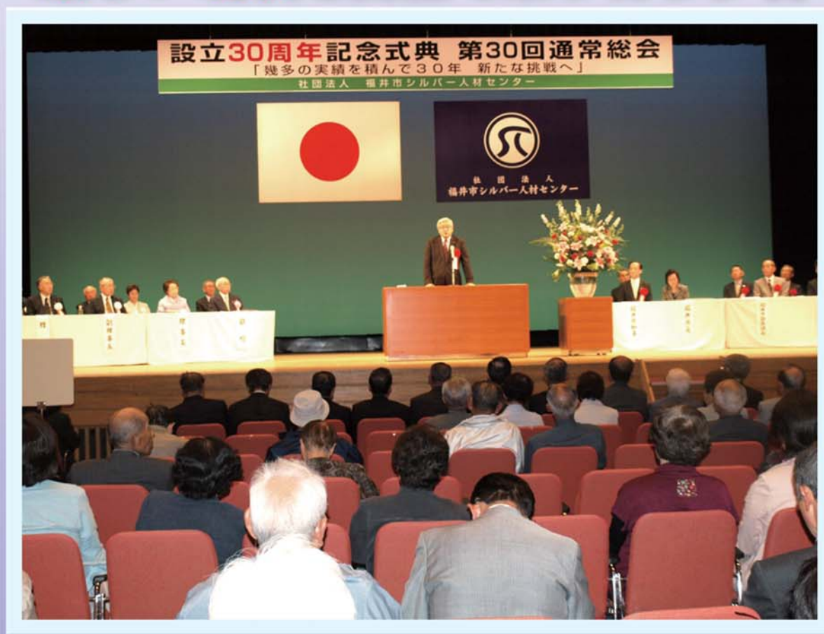
東村市長から祝辞を頂く