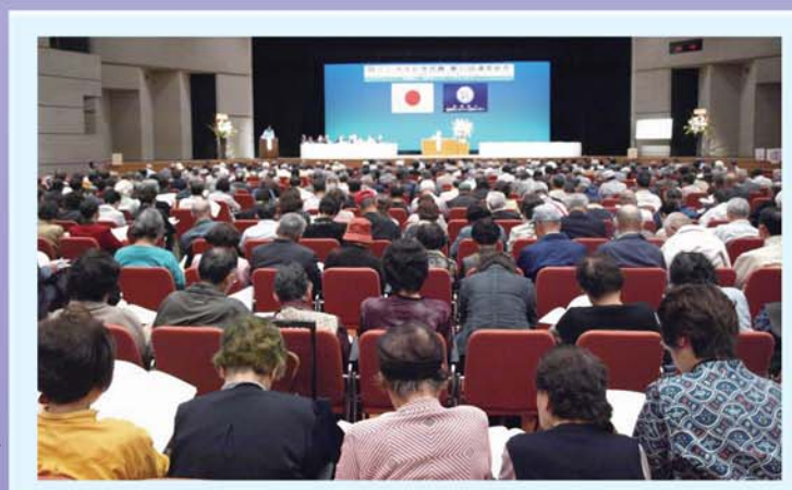
約900名の会員が会場を埋め尽くした