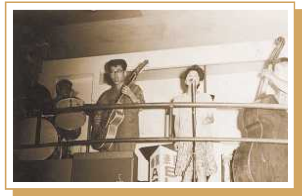
昭和41年 キャバレーロンドンにて

最後になりますが、私の好きな人生訓は「真剣、誠実、感謝」。この三つの言葉を大事にして、自分の人生の戦いに勝利していきたいと思います。