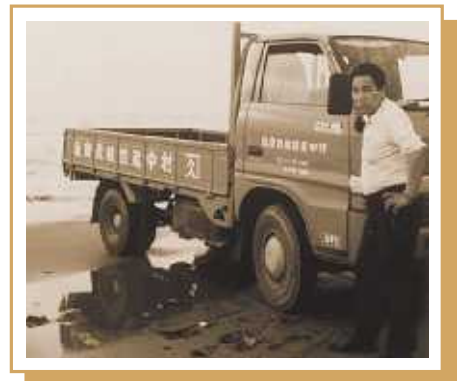
昭和58年 千里浜海岸にて

転に努めています。もちろん、高齢者の「もみじマーク」も厳守して。改めて運転免許証を取得しておいて良かったと思います。車ほど便利な物はありません。人間と違って、自分の思う通りに動いてくれるからです。こうして車と楽しめるのも、身体が健康だからです。「ありがたい。おかげさま。もったいない。」の三句を妻と共にかみしめながら、精進していきたいものです。