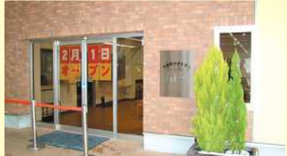
2月1日のオープンを待つ『旬菜』